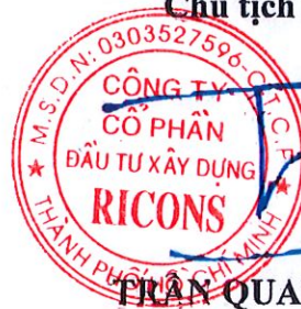
TRẦN QUANG QUÂN